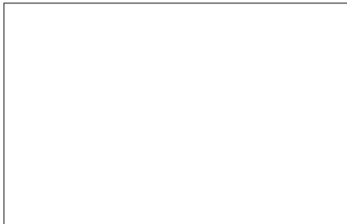
รูปที่ 2 ภาพถ่ายภายในบ้านนักเรียน